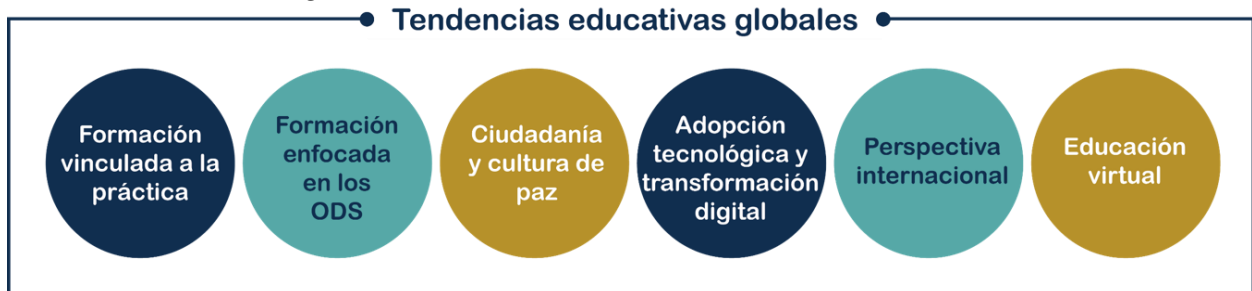
Figura 1 Tendencias educativas globales

En este contexto, como tendencias globales el Modelo Educativo para la Formación Integral de la Universidad (UADY, 2021) considera la formación vinculada a la práctica, formación enfocada en los Objetivos de Desarrollo Sostenible (ODS), ciudadanía y cultura de paz, adopción tecnológica y transformación digital y perspectiva internacional tal como se muestra en la Figura 1.